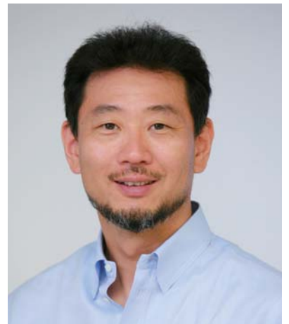
元スターバックスコーヒージャパンCEO リーダーシップコンサルティング代表

【著書】 「スターバックスCEOだった私が社員に贈り続けた31の言葉」(中経出版)、「ミッション」(アスコム)など