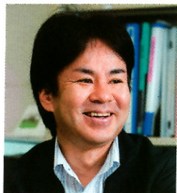
静岡県立大学経営情報学部教授 地域経営研究センター長

略歴 北里大学理学部物理学科卒業。平成12年4月エスエスケイフーズ(株)入社。平成15年6月現在のシーラック(株)入社。平成19年4月より取締役就任。平成21年4月より代表取締役就任、現在に至る。静岡県削節組合副理事兼焼津支部長、協同組合 焼津魚センター副理事。