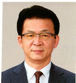
株式会社サンファーマーズ 代表取締役