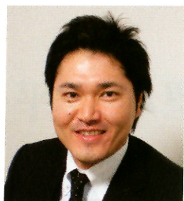
シーラック株式会社 代表取締役

略歴 東京農業大学卒業。昭和54年(有)稲吉種苗店入社、平成7年(有)ハニーポニック設立代表取締役就任、平成9年高糖度トマト「アメーラ」出荷開始、平成17年(株)サンファーマーズ設立。(有)ハニーポニック代表取締役、(株)サンファーム富士小山代表取締役、稲吉種苗(株)代表取締役会長、静岡県農業経営士